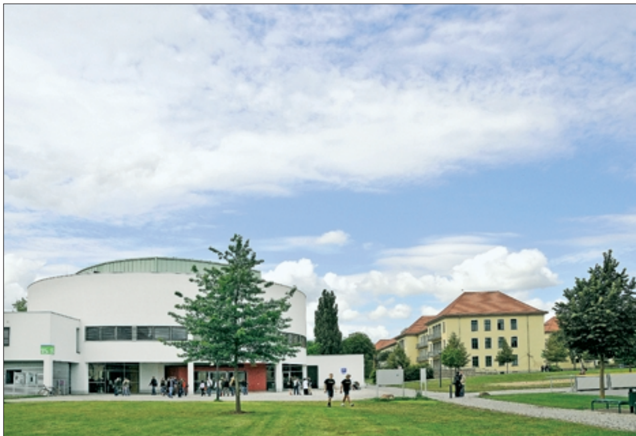
Gemeinsames Projekt mit der Universität Landau: Studenten der Hochschule Magdeburg-Stendal.