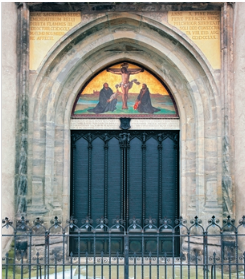
Schlosskirche in Wittenberg: Hier fand Luthers Thesenanschlag statt.

Seit dem Ende des Sozialismus klagt in Deutschland niemand mehr über einen Mangel an Freiheit, wohl aber an fehlenden Möglichkeiten, seine Freiheitsansprüche zu realisieren. Die Entwicklung seither ist gekennzeichnet durch eine zunehmende Ökonomisierung aller Lebensbereiche. Das zwingt die Politik, aber auch die Verfassungsgerichtsbarkeit, verstärkt den Blick auf die realen sozialen Bedingungen zu richten, unter denen die Grundrechte, in denen sich die vielfältigen Freiheitspostulate der Neuzeit realisieren, ausgeübt werden können. Die Freiheitsversprechen des demokratischen Rechtsstaates erfüllen sich in einer materiell ungleichen Gesellschaft nicht von selbst, sondern sind von sozialstaatlichen Unterstützungen abhängig, die als Ansprüche aus der offenen Gesellschaft an den Gesetzgeber herangezogen werden.