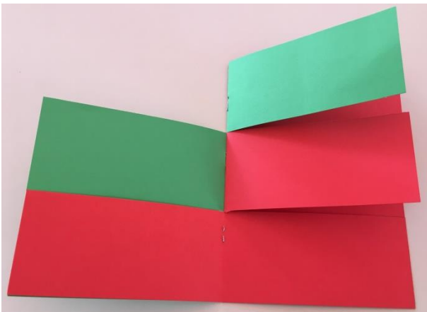
Das Klappbuch wird aus zwei DIN-A4-Blättern (festes Papier) gestaltet, die in der Mitte geheftet werden. So entsteht ein Buch aus vier Seiten. Die ersten drei Seiten werden zweimal eingeschnitten.