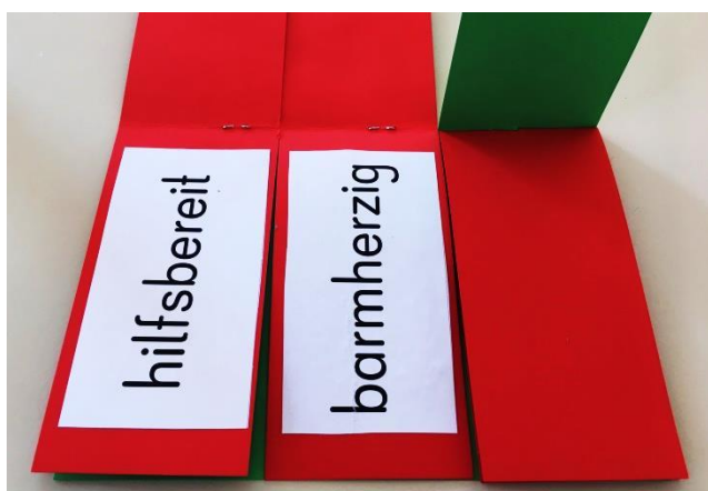
Klappbuch mittleres Drittel zum Barmherzigen Samariter Dritte Seite mit Sprechblase: Wort aus dem Wortfeld Barmherzigkeit