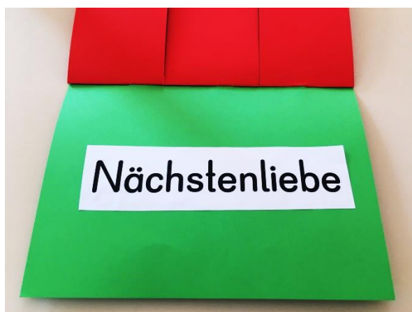
Vierte Seite des Klappbuchs: Nächstenliebe