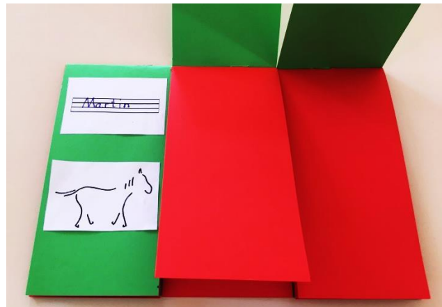
Klappbuch linkes Drittel zu Martin von Tours: Erste Seite: Sein Name, ein Symbol