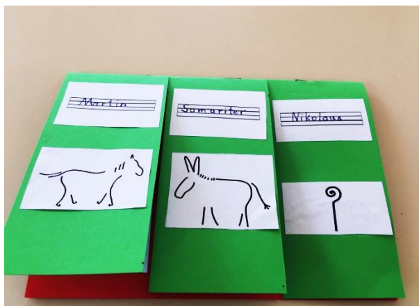
Klappbuch rechtes Drittel zu Nikolaus von Myra: Erste Seite: Sein Name, ein Symbol