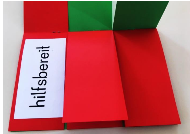
Klappbuch linkes Drittel zu Martin von Tours: Dritte Seite: Wort aus dem Wortfeld Barmherzigkeit