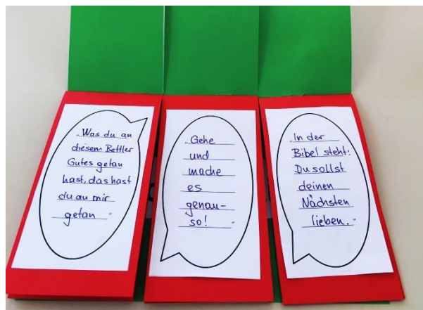
Klappbuch rechtes Drittel zu Nikolaus von Myra: Zweite Seite mit Sprechblase: Nikolaus hat einen Grund, dass er das Gold aus der Kirche genommen hat.