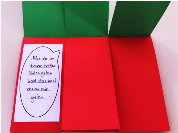
Klappbuch linkes Drittel zu Martin von Tours Zweite Seite mit Sprechblase: Was sagt die Stimme, die Martin im Traum hört?