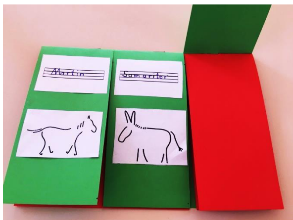
Klappbuch mittleres Drittel zum Barmherzigen Samariter Erste Seite: Sein Name, ein Symbol