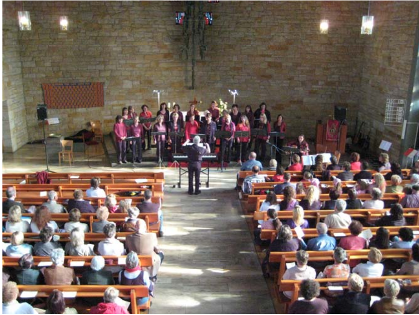
Foto: Chorkonzert am 6. Juni 2009

institutionalisiert und den Anschluss an die Johanneskirchengemeinde beschlossen.