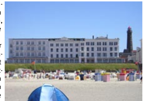
CVJM-Haus Viktoria, Borkum