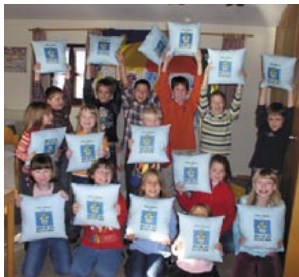
KiGo-Kinder mit KiGo-Kissen