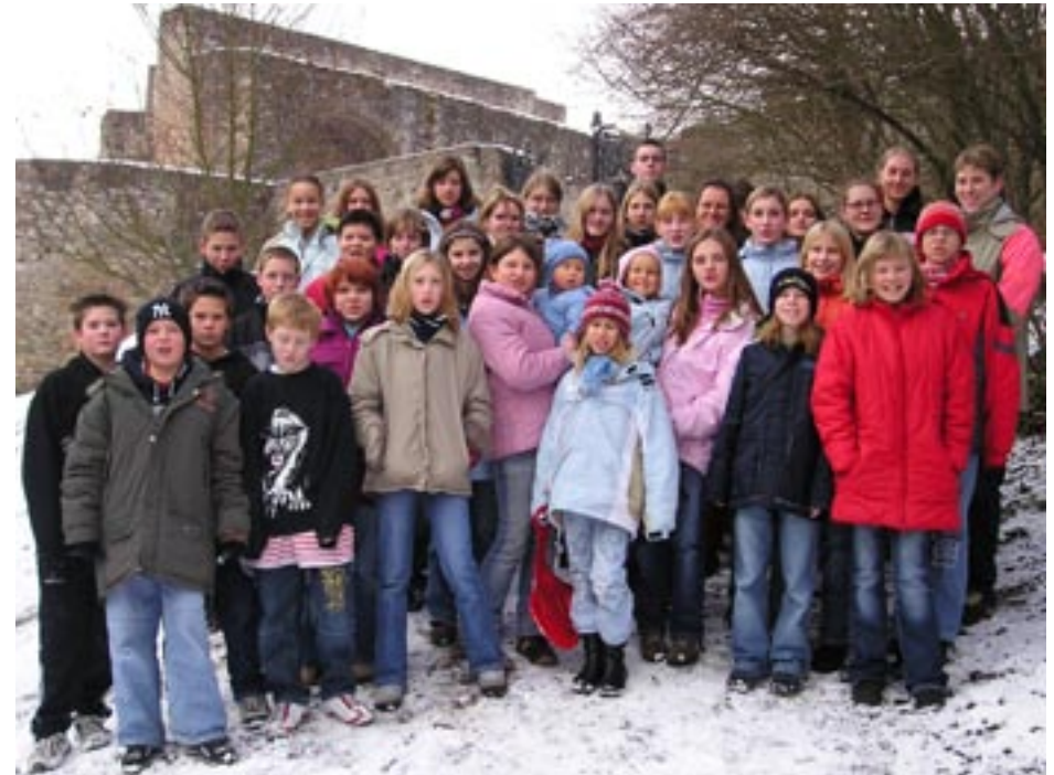
Präpis auf der Burg Lichtenberg