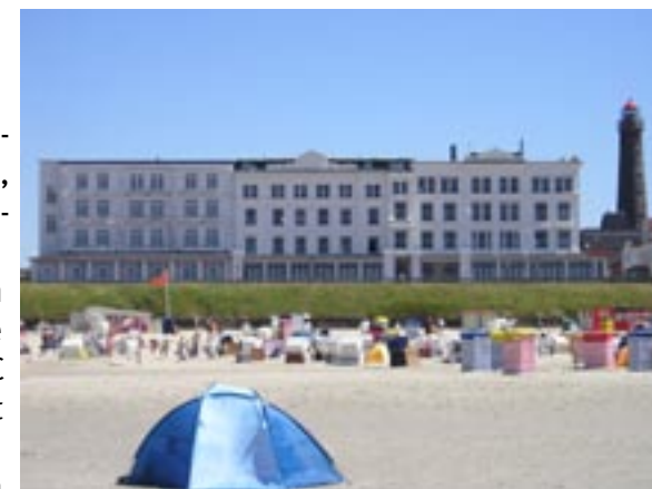
CVJM-Haus Viktoria, Borkum