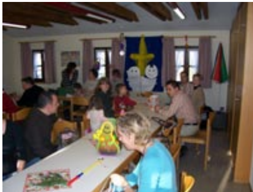
Viel Spaß beim Essen und Basteln!

Herzlichen Dank an alle Frauen, die unsere Brunchtafel mit so vielen Köstlichkeiten schmückten. Unser nächster Familientag wird im Frühjahr stattfinden.