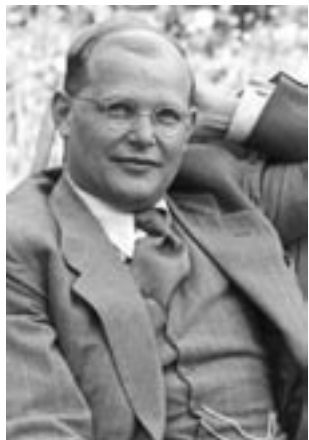
D. Bonhoeffer, 4.2.1906–8.4.1945

Der Verein „Kinder von Shitkowitschi – Leben nach Tschernobyl“ hat es sich zur Aufgabe gesetzt vor allem diesen Kindern durch eine Erholung in unserer Pfalz zu helfen. Die Kinder leiden an akutem Vitaminmangel und