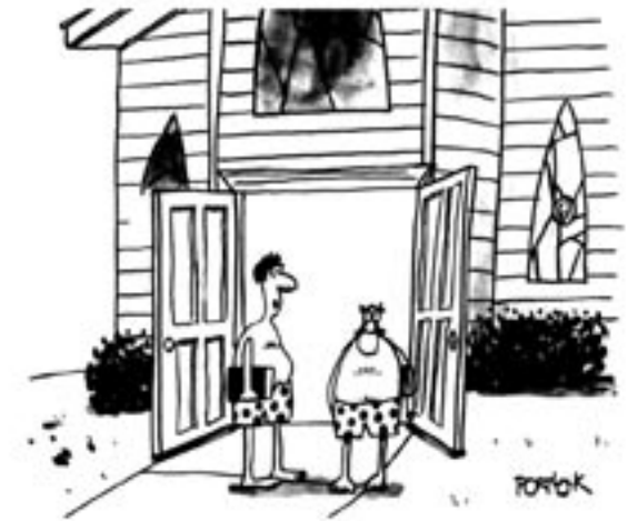
„Die beste Predigt über Cpfern und Spenden, die ich je gehört habe!“

Darin gibt es neben Spenden-Tipps etwa in bezug auf Katastrophenhilfe, Patenschaften, Altkleidersamm-