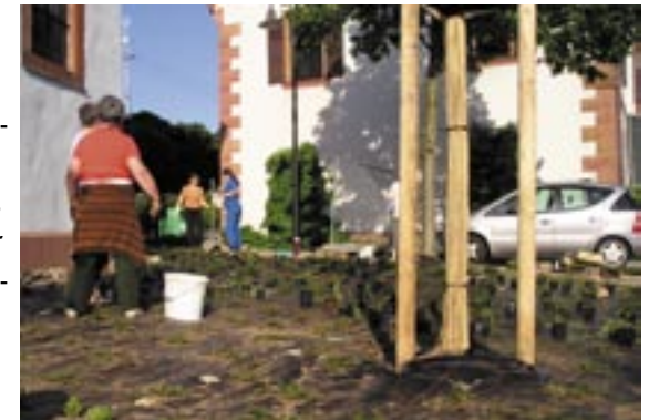
Hunderte von Setzlingen