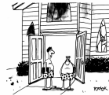
„Die beste Predigt über Opfern und Spenden, die ich je gehört habe!“