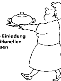
Herzliche Einladung zum traditionellen Eintopfessen

Der Obst- und Gartenbauverein Miesau wird seine Veranstaltung zum Erntedank am 6. Oktober durchführen.