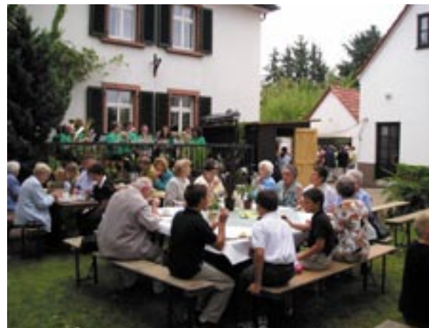
Musikverein und Kirchfestgäste