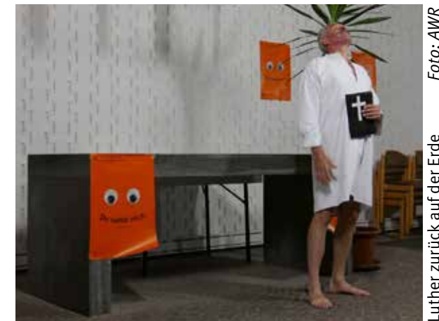
Luther zurück auf der Erde