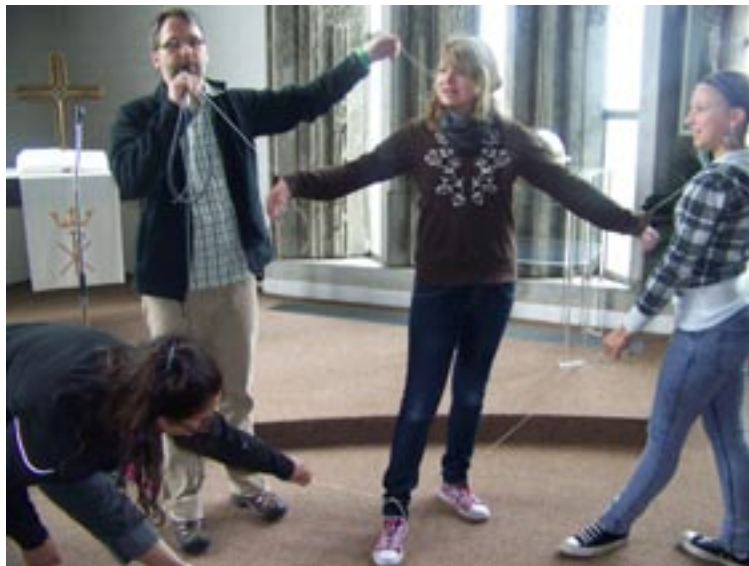
Konfis und Kollegen in Aktion

Eine Gruppe untersuchte in einem Rollenspiel die verschiedenen Phasen einer Sucht. Eine weitere beschäftigte sich mit Formen von Sucht und der Frage, ob sie eher eine körperliche oder seelische Abhängigkeit hervorrufen.