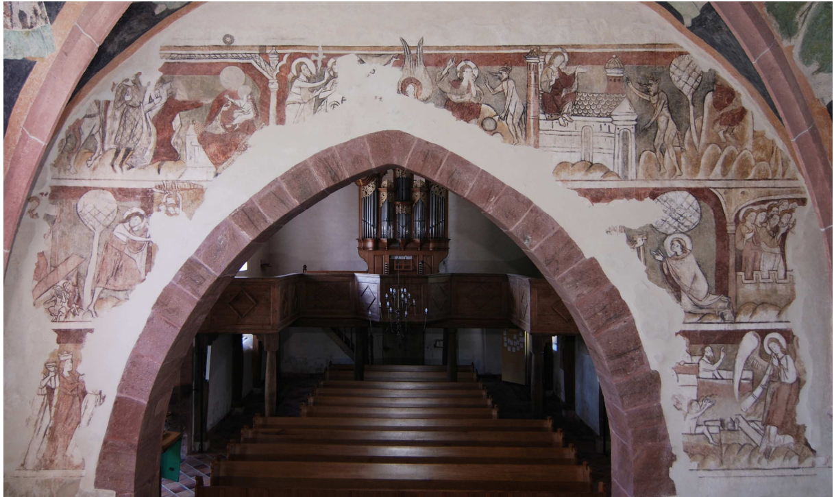
Bild 6: Der restaurierte Christuszyklus, Westwand des Chorraums der Minfeld Kirche