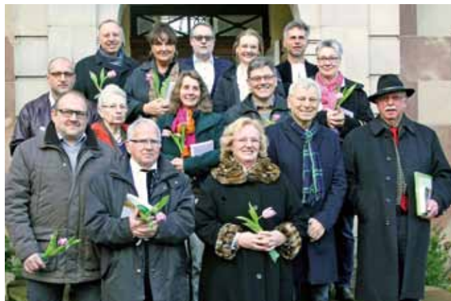
Das neue Presbyterium der Kirchengemeinde Blieskastel