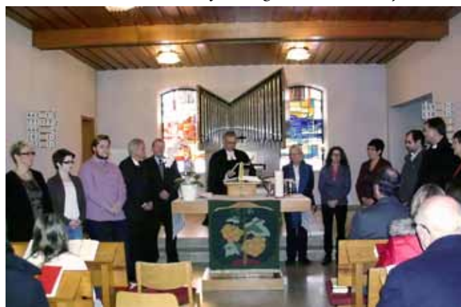
Einführung des neuen Presbyteriums

Bei Interesse können Sie dies gerne mit Pfr. Glitt absprechen.