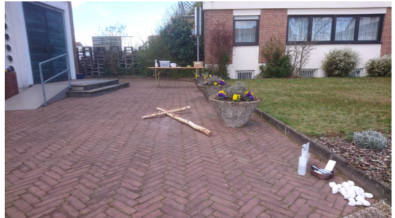
Osteraktion 2021