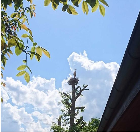
Storch im Kirchgarten