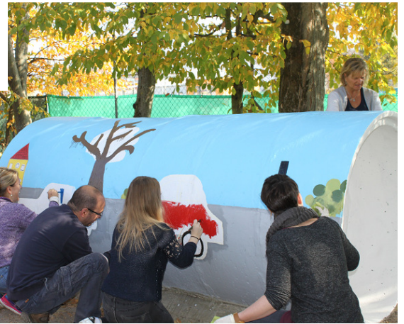
Auch für die Insekten wurde ein schönes Häuschen gestaltet