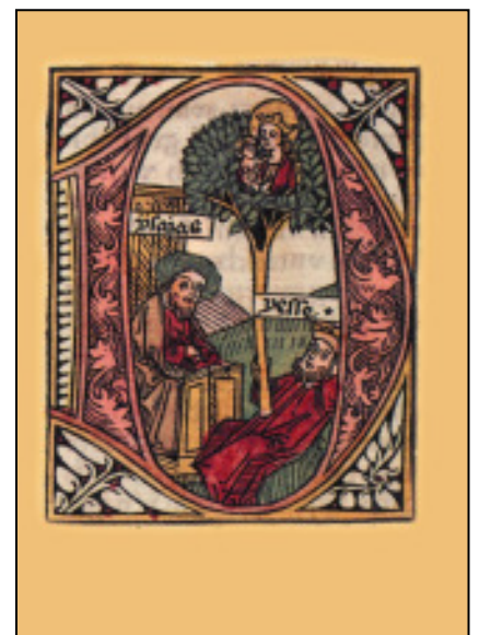
Nr. 4 „Wurzel Jesse“ (typol. Deutung Jes. 11) Zainer-Bibel 1475 Klappkarte

Zentralarchiv der Ev. Kirche der Pfalz Domplatz 6, 67346 Speyer Tel.: 06232-667 182 eMail: gabriele.stueber@evkirchepfalz.de www.zentralarchiv-speyer.de