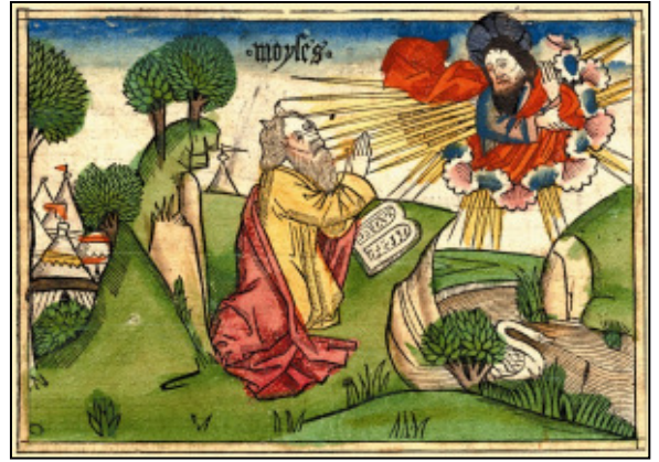
Nr. 2 Mose empfängt die Zehn Gebote (2. Mose 34) Koberger Bibel, Nürnberg 1483 Klappkarte