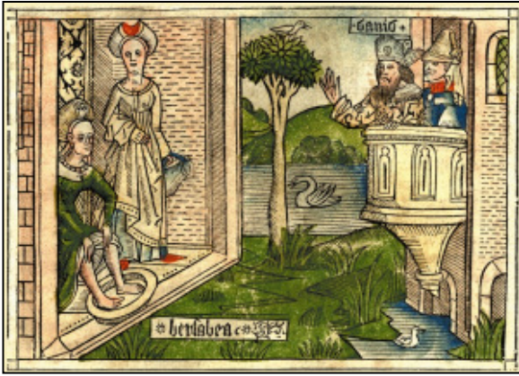
Nr. 1 David und Bathseba (2. Sam. 11,2) Koberger Bibel, Nürnberg 1483 Postkarte