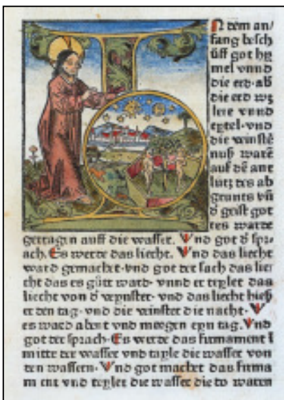
Nr. 3 Anfang der Schöpfungsgeschichte Zainer-Bibel 1475 Postkarte