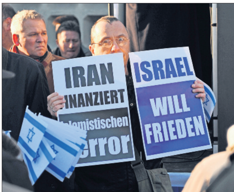
Einseitige Solidarität mit Israel: Plakate bei einer Kundgebung in Berlin.

Israel soll bei der Lösung seiner Konflikte nicht nur aufs Militär setzen.