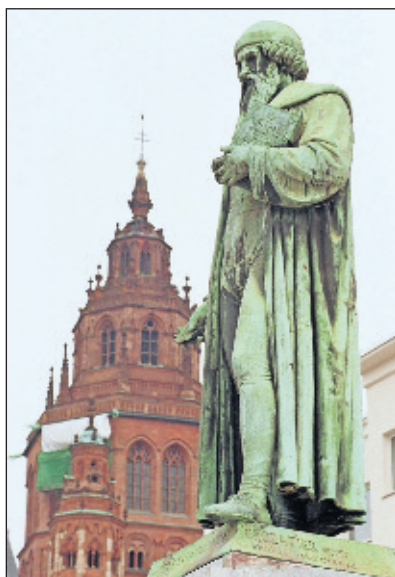
Johannes Gutenberg: Beginn der Selbsterweiterung durch Medien.