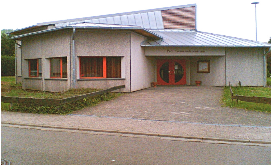
Prot. Gemeindezentrum Ludwigsthal