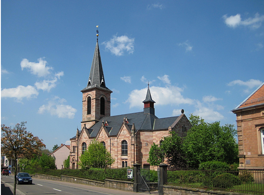
Prot. Kirche Bexbach