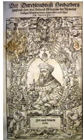
Widmungsblatt Friedrich III.